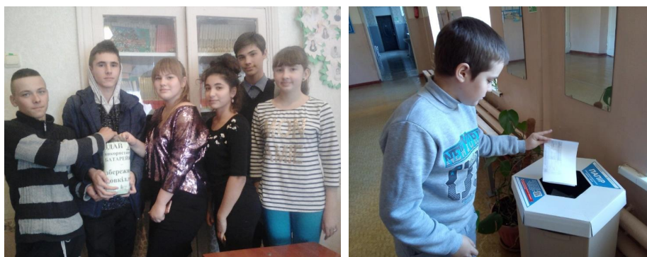
Рис. 4, 5 – Встановлення контейнерів для збору макулатури [4]