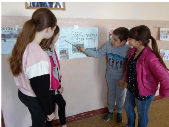
Рис. 1 – Презентація плакатів «Зелені міста»

На сьогодні триває робота над другим етапом проєкту – «Екологічні челенджі»: