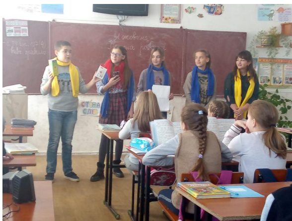
Рис. 2 – Виступ екологічної агіт-бригади перед учнями молодших класів