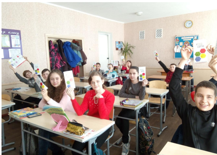
Рис. 3 – Тренінг «Вчимося бути еко-відповідальними» [2, С. 142–148]