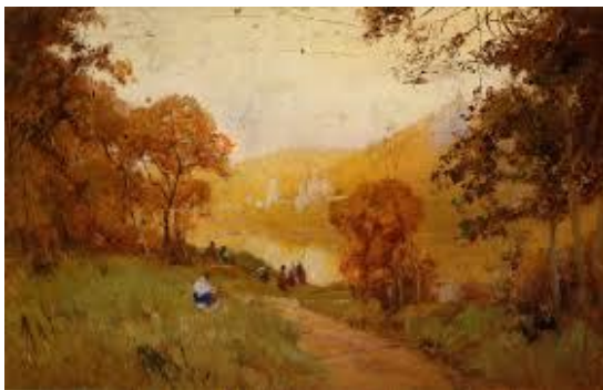
Рис. 1 – С. Васильківський. «Святі Гори» Х. м.

Святогірський монастир і краса Святих Гір зафіксовані на полотнах відомих художників XIX ст. У колекціях музеїв України зберігаються твори святогірського циклу відомого українського пейзажиста С. І. Васильківського. Картина була написана із одного з найулюбленіших місць живописців XX ст. на правому березі Дінця – з тераси садиби Потьомкіних. Теплі кольори та контрастність передають атмосферу спокою світанку Святих Гір. Полотно і зараз зберігається у фондах Харківського краєзнавчого музею (рис. 1) [3, с. 237].